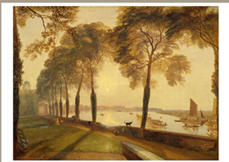
Mortlake Terrace, 1827 Huile sur toile, 92,1 x 122,2 cm Washington, National Gallery of Art