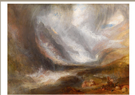
Valley of Aosta: Snowstorm, Avalanche, and Thunderstorm [Vallée d'Aoste : tempête de neige, avalanche et orage], 1836-1837 Huile sur toile, 92,2 x 123 cm The Art Institute of Chicago