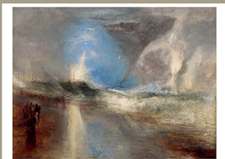
Rockets and Blue Lights (Close at Hand) to Warn Steamboats of Shoal Water [Fusées et leurs bleues (à portée de main) pour signaler un banc de sable aux bateaux à vapeur], 1840 Huile sur toile, 91,2 x 122,2 cm Williamstown, Clark Art Institute