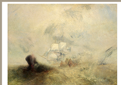
Whalers [Baleiniers], vers 1845 Huile sur toile, 91,8 x 122,6 cm New York, The Metropolitan Museum of Art