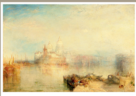
The Dogana and Santa Maria della Salute, Venice [La Dogana et Santa Maria della Salute, Venise], 1843 Huile sur toile, 62 x 93 cm Washington, National Gallery of Art