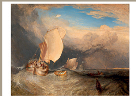
Fishing Boats with Hucksters Bargaining for Fish [Bateaux de pêche et colporteurs négociant le prix du poisson], 1837-1838 Huile sur toile, 174,5 x 224,9 cm The Art Institute of Chicago