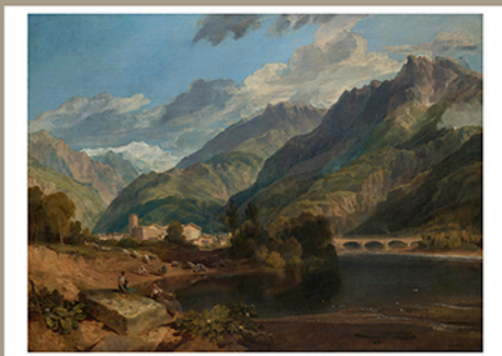
Bonneville, Savoy [Bonneville, Savoie], vers 1812 Huile sur toile, 92,9 x 123,8 cm Philadelphia Museum of Art