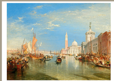
The Dogana and San Giorgio Maggiore [La Dogana et San Giorgio Maggiore], 1834 Huile sur toile, 91,5 x 122 cm Washington, National Gallery of Art